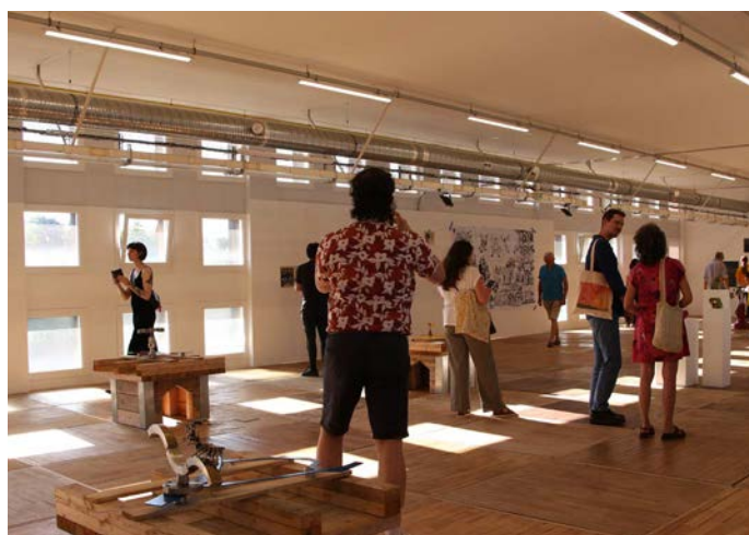
Exposition Apologie , Aurore-Caroline Marty, 2angles, 2025, 2angles, crédit photographique : Anthony Girardi.