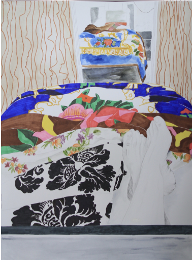
Personal Space #1, Mixed media on paper 50 x 70 cm | Lina Bani Odeh, 2016